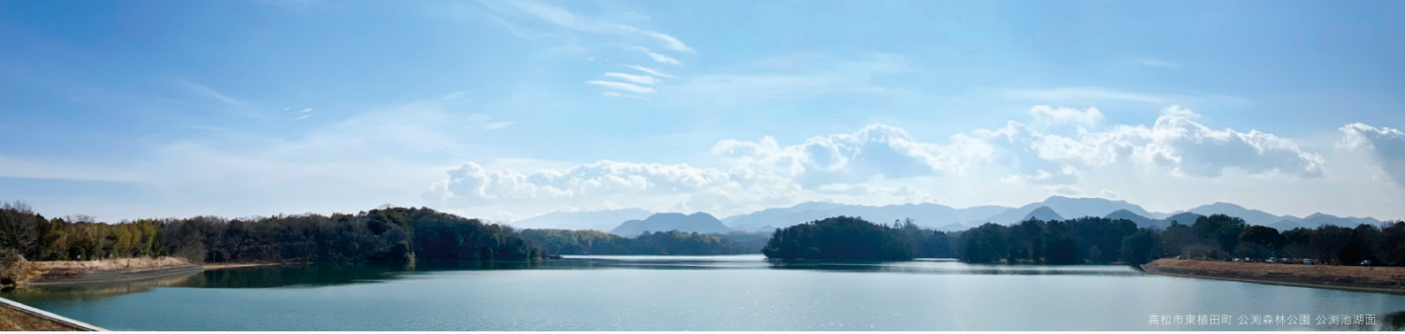
高松市東植田町 公測森林公園 公測池湖面